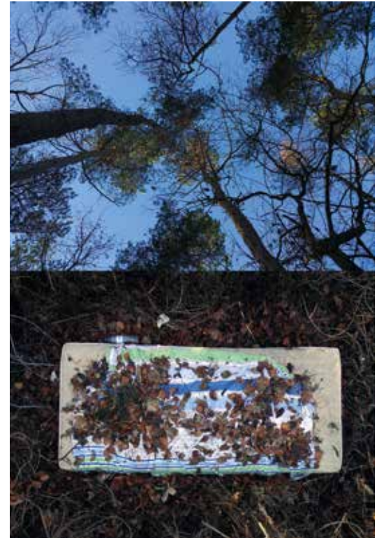
„Bethe“, 2018 Fotografie, Plexiglas, 60 x 45 x 30 cm, Edition 3

*1963. Seit dem 11.Lebensjahr Fotos gemacht. Seit 2005 über 60 Fotoausstellungen im "PHOTOPLATZ_ _ _ _" durchgeführt. Diverse Themen-Ausstellungsbeteiligungen mit eigenen Bildern. Eine Soloausstellung "Dazwischen" als Pilotausstellung im eigenen Ausstellungsraum. 2018 Projektbeteiligung am "Caruso sings again" Festival des www.kronenboden.de.