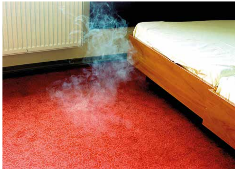
„ODER, POLEN“, 2004 Ink-Jet Print auf Fine Art Paper, matt, 13 x 18 cm, gerahmt (Holz, Perlmutterintarsien, aus Persien) 25 x 31 cm, Unikat

2017 Gruppenausstellung Chengdu Photography Center, China, Auszüge aus „Cluster I / II“; 2016 Einladung zur Charity von Placet e. V. und Kunstauktionshaus Lempertz, Hotel de Rome, Berlin; 2015 Soloshow Galerie NR/Projects, Berlin, Auszüge aus „The last Chapter“; 2015 Publikation im Magazin The Weekender, Künstlerporträt von Aldo Cristofaro; 2015 Privater Porträtauftrag für König Juan Carlos I. von Spanien; 2014 Grosse Portfolioshow, Galerie Pavlov's dog, Berlin, mit F. C. Gundlach und Ingo Taubhorn; 2013 Mitgestaltung des Filmsets „Coming in“, Auszüge aus „Cluster II“; 2012 Gruppenausstellung zum Gallery Weekend '12, Berlin, Galeries Lafayette, Auszüge aus „Serie francaise“, Installation im öffentlichen Raum; 2011 Fotobuchfestival Kijk-papers in Kassel, „Katalog – 5 Essays“; 2005 Internationales Fotofestival in Perpignan, Frankreich, „Dämonen“; 2004 bis 2006 Studium an der Ostkreuzschule für Fotografie, Berlin bei Prof. Ute Mahler, Werner Mahler, Sybille Bergemann.