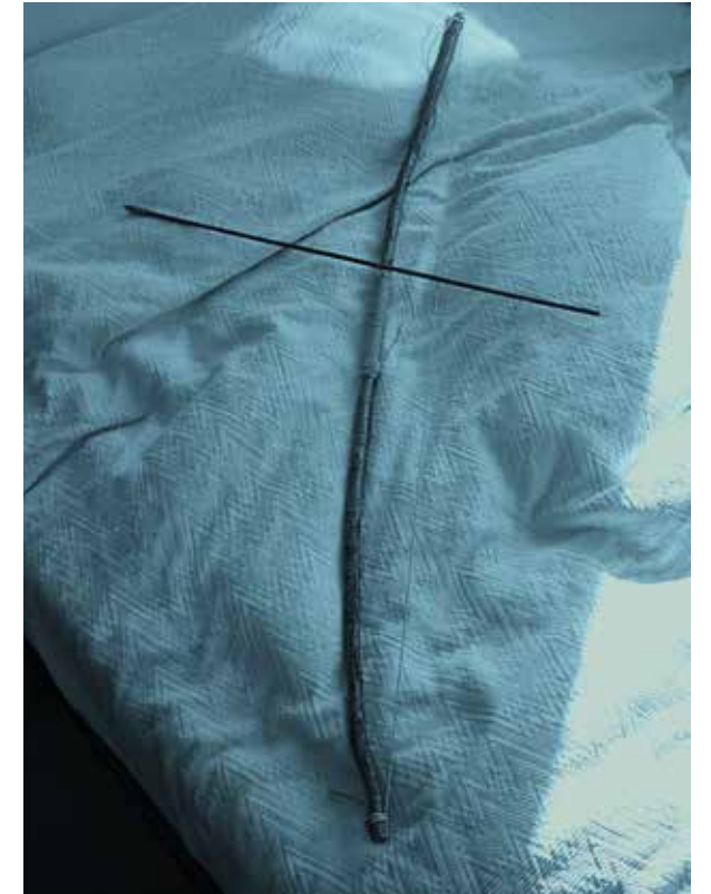
„Zeit ist mein Pfeil, Erinnerung mein Bogen“, 2016 C-Print im Rahmen, 18 x 24 cm / 30 x 40 cm, Unikat

Autor & Photographer. Schreibt für diverse Medien, Verlage und Künstler.