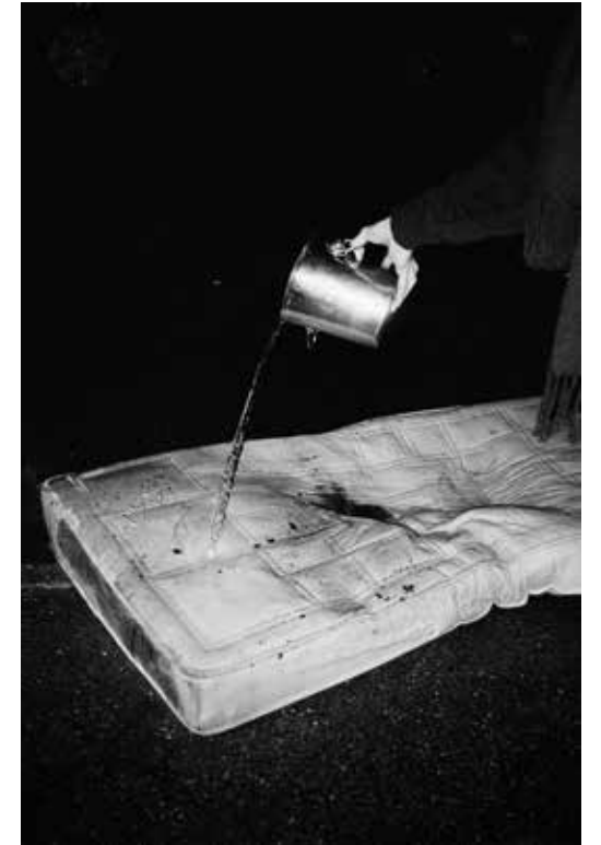
„Enuresis nocturna“ (aus der Serie Off Keel), 2017 Archival Pigment Print auf Baryt-Papier und Aluminium, 54 x 36 cm, Edition 1/5 (5 + 2 AP)

Torsten Schumann (*1975 in Dresden) fotografiert vorgefundene Situationen und Dinge im urbanen Raum. Er lebt und arbeitet in Berlin. Seine Arbeiten wurden in Gruppenausstellungen wie der Context 2015 des Filter Photo Festivals in Chicago und FAUX 2016 im Center for Fine Art Photography, Fort Collins gezeigt und waren auf Festivals wie Circulation(s) Paris 2015 und Head On Photofestival Sydney 2017 vertreten. Torsten Schumann erhielt Preise wie den Arte Laguna Preis in Venedig 2012, den OPUS Kulturmagazin Fotopreis 2015 und den PDN Annual Photo Award 2017. Seine Arbeiten sind im Buch „Humble Cats: New Cats in Art Photography“, Yoffy Press 2017 sowie in „Die Nacht“ #20 vertreten und waren im ZEIT Magazin #45/2017 zu sehen. „Off Keel“ wurde auf die Shortlists des UNSEEN Dummy Awards 2016 sowie des Kassel Dummy Awards 2017 gewählt. 2016 veröffentlichte Torsten Schumann sein Fotobuch „More Cars, Clothes and Cabbages“ bei Peperoni Books.