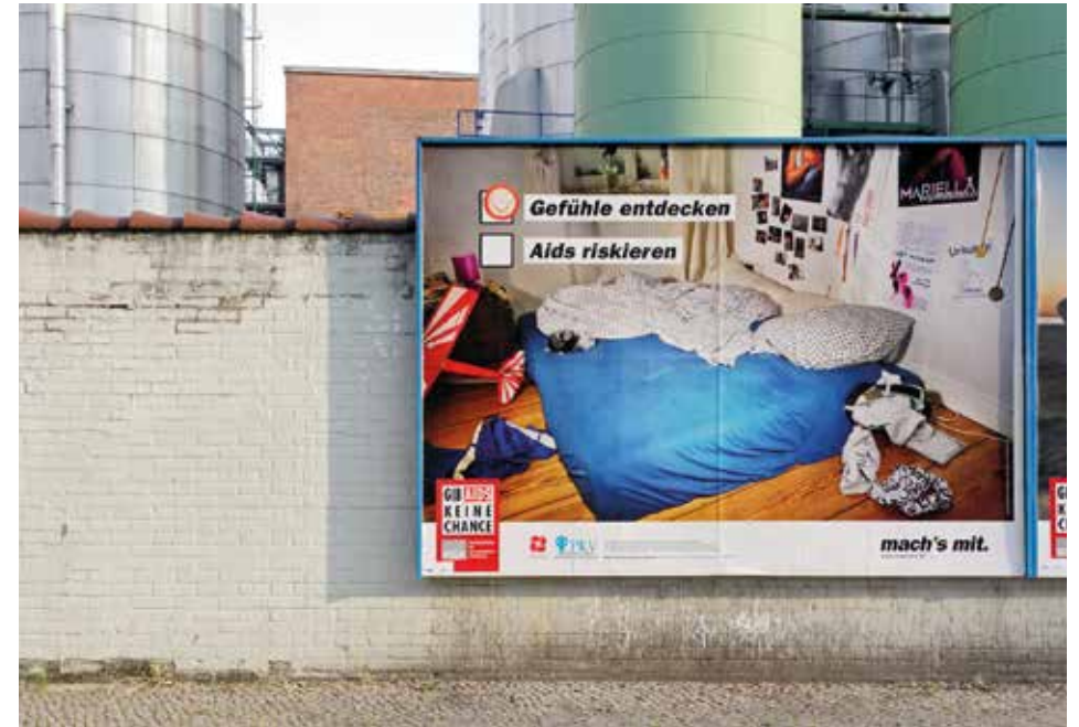
„Quedlinburger Straße, Berlin-Charlottenburg“, 2010 FineArtPrint, 30 x 45 cm, gerahmt 53 x 68 cm, Edition 1/12

Geboren 1963 in Ludwigshafen am Rhein, Architekt und Stadtfotograf, lebt und arbeitet seit 1984 in Berlin.