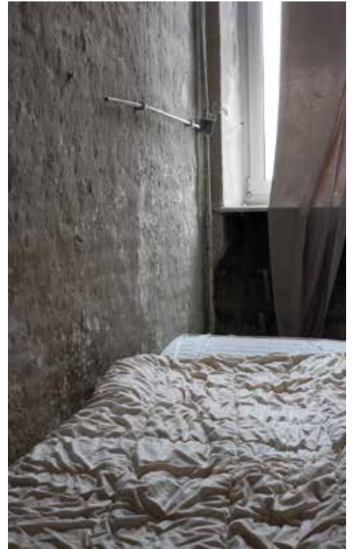
„Asyl“, 2009 Pigmentdruck, Aludibond, 60 x 90 cm, Unikat