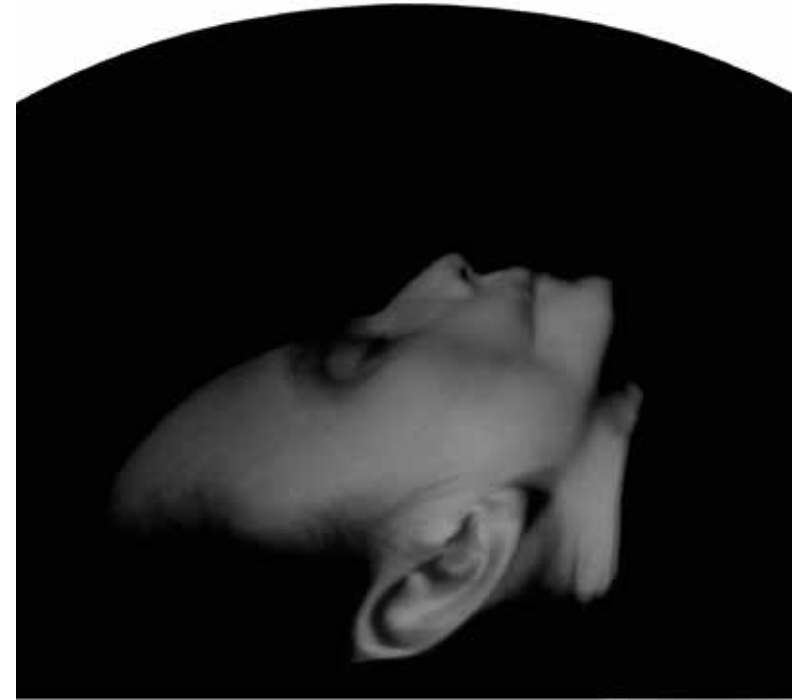
„ Boska beztroška I “ (aus dem Projekt EXodus ), 2008 Lochkamerafotografie auf Silbergelatinepapier, getont, 21,0/25,2 x 30,2 cm, Edition 5 + 2 AP

* in Polen, Fotokünstlerin, arbeitet v.a. mit Lochkamera und nutzt analoge Bildmanipulationen; in ihren Fotoarbeiten und Installationen beschäftigt sie sich mit den Themen Identität, Entschleunigung und Vergänglichkeit sowie mit der allgegenwärtigen Überwachung der Gesellschaft, seit 1993 zahlreiche Einzel- und Gruppenausstellungen, Arbeiten in diversen Sammlungen, sie lehrt Fotografie und Fotografiegeschichte, gibt Fotografieworkshops mit Flüchtlingen, u.a. Zusammenarbeit mit PhotoWerkBerlin und C/O Berlin; georgia Krawiec lebt und arbeitet in Berlin & Warschau.