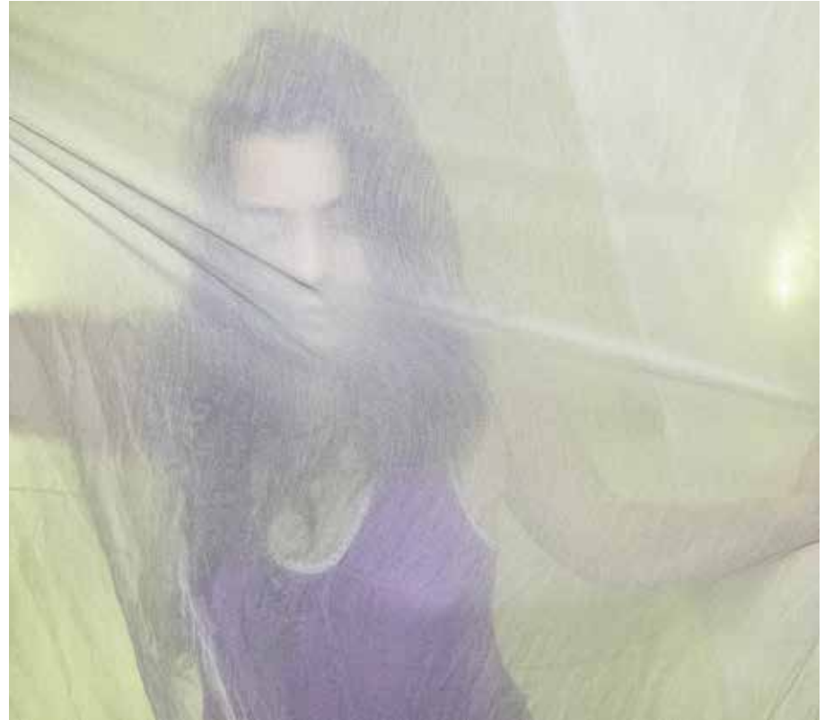
Ohne Titel, 2018 Fine Art Print 22 x 30 cm, Edition 5 + 2 AP