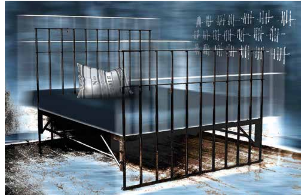
"BED/BAD MEMORIES", 2017 C-Print hinter ACRYL-Rahmenbox, 30 x 45 cm, Edition 10 + 1 AP

Geboren in Berlin. Wohne in Friedenau. Hier künstlerisch aktiv in der Fotografie, Malerei und Grafik. Meine Wege: Studium als Gebrauchsgrafikerin / Grafikdesign in Werbeabteilungen / Reprotechnik im Fotolabor und Grafik, analog und digital zur Darstellung geologischer Sachverhalte, Bereich Fernerkundung FU Berlin / Weiterbildung FH für Foto-Optik Berlin / Workshops Akademie für Malerei / Digitalgenerierte Malerei / Experimentelle Fotografie, zuletzt Schwerpunkt Schwarz-Weiss / Öffentliche Präsentationen, Einzel- und Gruppenausstellungen in verschiedenen Kunstforen / Seit 2011 Teilnahme an der "Südwestpassage Kultour" / in diesem Jahr wieder Artist bei SHOW YOUR DARLING.