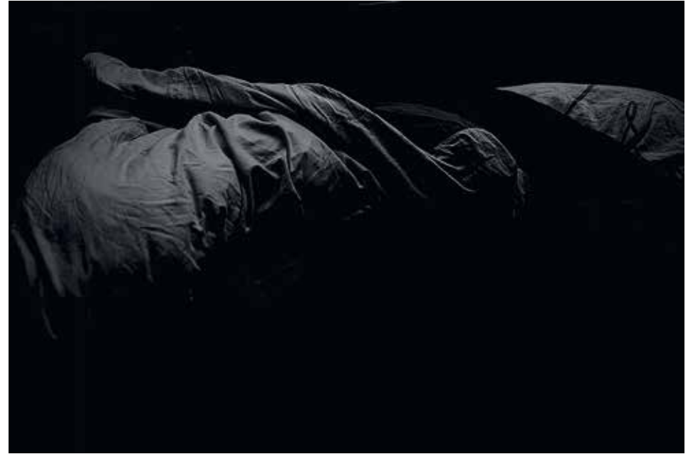
„Nachthülle_1003385“, 2014 C-Print auf Hahnemühle-Photrag, 42 x 59,4 cm, gerahmt, Edition 5 + 1 AP

* 1962 in Padua, Italien. Lebt und arbeitet seit 1985 in Berlin. Studium der Germanistik, Linguistik und Spanisch. Freie Fotografie seit 2003. 2007-2008 Seminar bei Jonas Maron an der Ostkreuzschule für Fotografie. 2005 Gründungsmitglied der Produzentengalerie „Galerie en passant“, heute „ep.contemporary“. 2009-2014 Jurymitglied Stiftung Kunstfonds, Bonn. Seit 2008 Initiatorin und Organisatorin des jährlich stattfindenden Kulturrundgangs Südwestpassage Kultour in Berlin Friedenau.