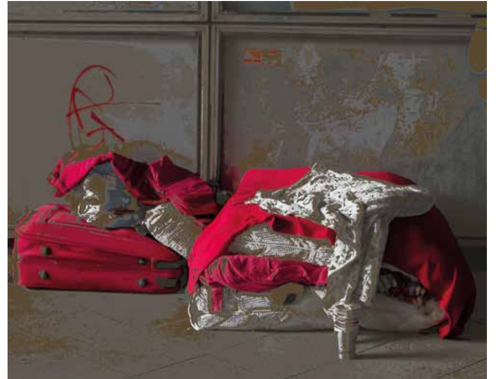
„Streetstyle“, 2018-2 Finart Inkjet Print auf MuseoMax / AluDibond, 44 x 60 cm, Edition 5 + 1 AP

Geb. 1962 in São Paulo. Lebt und arbeitet in Berlin. Studium der Malerei/Kunst am Bau in Maastricht und Düsseldorf. Lebte in Brasilien, Griechenland und den Niederlanden. Vortragsreihen und Publikationen zu realen und virtuellen Räumen in einer digitalen Zeit. Seit 1987 freischaffend mit Malerei, Kunst am Bau und Fotografie. 2013 Mitglied der Produzentengalerie „en passant“. 2016 Mitgründerin der Produzentengalerie ep.contemporary (Berlin), ehemals Galerie en passant.