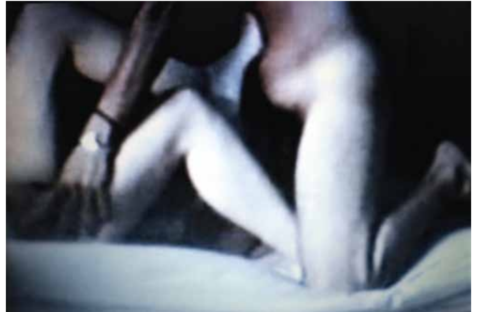
„belly and foot“ aus der Serie / dem Buch private rooms , 2015 digitale Fotografie, Tintenstrahl Druck auf Hahnemühle-PhotoRag 308g, 12 cm x 18 cm auf 14 x 20 cm, Edition 10

Geboren 1966 in Schleswig-Holstein, lebt und arbeitet in Berlin und Fürstenberg. Studium an der Ostkreuzschule für Fotografie. Bei Peperoni Books erschienen die Bücher einer, zwei, drei , one circle , private rooms und two mothers . Das Buch private rooms (Peperoni Books, 2015) ist Teil des Projektes Surveillance Index Edition One des amerikanischen Kurators Mark Ghuneim. Diese Sammlung von einhundert Büchern zur Überwachungsfotografie existiert als Website und als großformatiges Buch. Im Januar 2018 wurden die ausgewählten Bücher bei LE BAL in Paris ausgestellt.