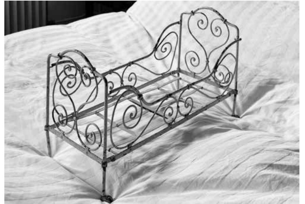
„Bett im Bett“, 2018 S/W-Fotografie, analog, Vergrößerung auf Barytpapier 30 x 40 cm, Edition 12

Geboren 1958 in Erlangen. Studium Klassische Philologie und Geschichte in München und Berlin bis 1983. 1984/85 an der Werkstatt für Photographie in Kreuzberg; Fotografie seit 1979. Erste Ausstellung 1986 in der Galerie im Körnerpark, Neukölln. Seither Ausstellungen und Veröffentlichungen in Büchern, Katalogen und Magazinen. Seit 2014 auch als Galerist im eigenen Atelier tätig.