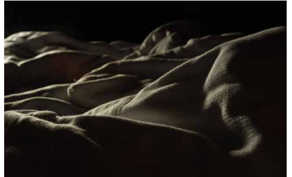
„Der täglich wiederkehrende Moment der Auflösung“, 2017 Pigmentdruck auf Baumwollpapier, 42 x 60 cm, Edition 7

1965 in Bremen geboren, aufgewachsen im Teufelsmoor nördlich von Bremen. Fotografische Arbeiten seit 1980. Malerei, Zeichnung und Plastik 1980-1989. Studium der Philosophie an der Freien Universität Berlin 1989-1996. Freiberufliche Arbeit als Fotograf seit 1996. Studio, Werkstatt und Galerie „Straßenbild“ in Berlin Charlottenburg 1999-2001. Seit 2003 Teilnahme an Ausstellungen und Kunstprojekten.