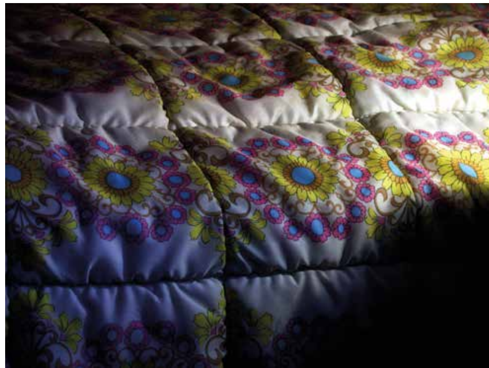
„Wietzendorf“ (aus der Serie „After This Darkness There Is Another“), 2010 C-Print auf Aludibnd, 42 x 59,4 cm, Edition 7 + 2 AP

Marc Peschke, 1970 in Offenbach am Main geboren, lebt in Hamburg und Wertheim am Main, wo er als Kurator den exklusiven Kunstraum „Atelier Schwab“ mit betreibt. Er arbeitet als Kunsthistoriker, Kulturjournalist und Texter. Seit 2008 eigene Ausstellungen im In- und Ausland. Marc Peschkes Arbeiten sind in verschiedenen Sammlungen vertreten.