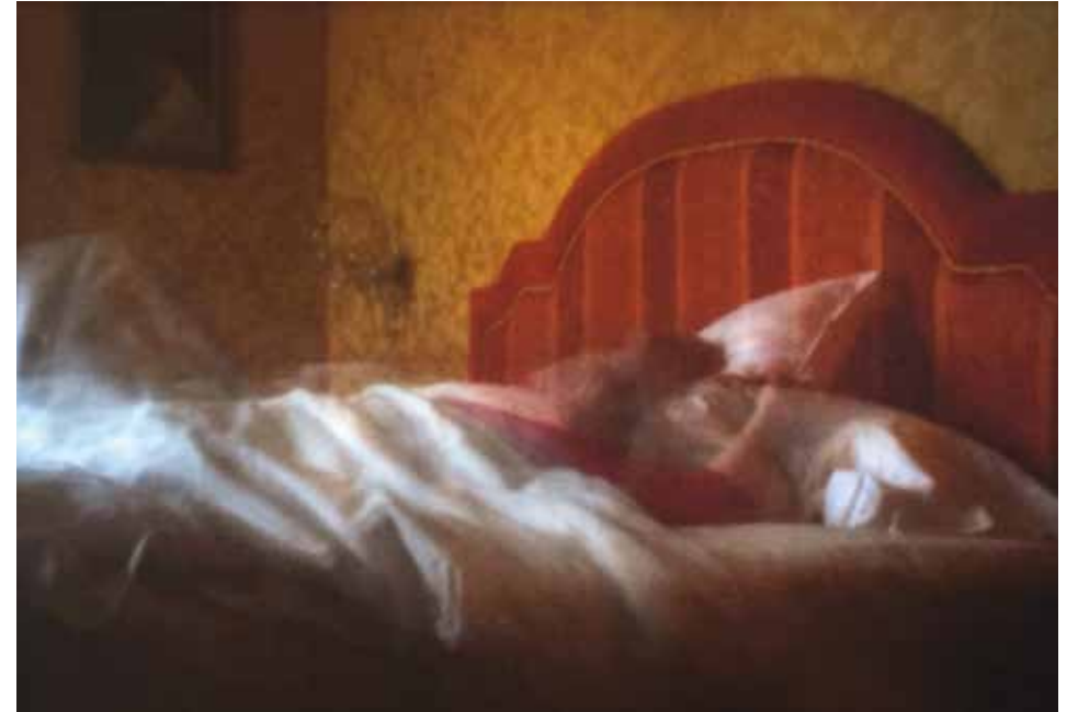
„Caruso Suite, Hotel Vesuvio, Neapel“, 2018 Camera obscura Langzeitbelichtung, analog. PigmentPrint auf Hahnemühle PhotoRag, 30 x 45 cm, gerahmt, Edition 8 + 2 AP