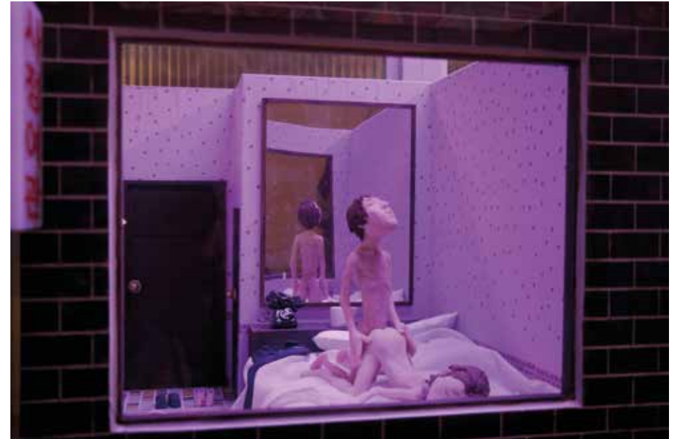
„Ejaculation Motel“, 2011 PigmentPrint, 42 x 59,4 cm gerahmt, Edition 5 + 1 AP

Based in Seoul, South Korea, Nils has shot, directed and edited a number of award-winning music videos, short, feature and documentary films, which have been screened at various international festivals or went viral online. Initially Nils found his way into filmmaking through photography. After studying in Germany, Australia and Hong Kong, Nils completed his MFA in Cinematography at the Graduate School of Advanced Imaging Science, Multimedia and Film at Chungang University in Seoul. Born and raised in Germany, Nils has been living in South Korea since the end of 2005.