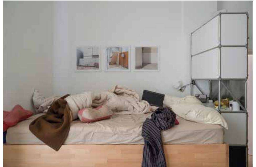
Ohne Titel, 2018 Fine-Art-Pigmentdruck, 30 x 20 cm, gerahmt 45 x 35 cm, Unikat